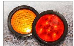
Luces LED Más brillante sin filamento que se queme. Vida prácticamente ilimitada Carcasa amortiguadora