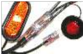
Arnés de cableado 100% sellado Usa arnés Plus (bloqueo positivo bajo sello) Más brillante sin filamento que se queme. Vida prácticamente ilimitada Carcasa amortiguadora