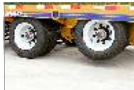
Eje delantero de elevación de aire Suspensión compacta-trac. El diseño ultraelevador no requiere modificación del marco. El nuevo diseño proporciona máxima elevación y distancia al suelo. Fabricado exclusivamente para Eager Beaver Trailers