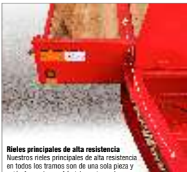
Rieles principales de alta resistencia Nuestros rieles principales de alta resistencia en todos los tramos son de una sola pieza y están formados en frío (sin cortar, volver a soldar ni plantar) y se extienden desde la parte delantera de la barra de tiro hasta la parte trasera del remolque.