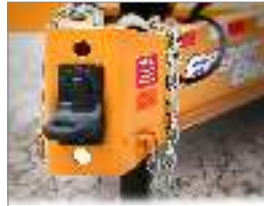
Enganche de ojo de acero fundido de una sola pieza