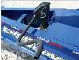
Gato de estacionamiento de 2 velocidades para trabajo pesado con capacidad estática de 70000# Estándar en todos los remolques de 15 a 25 toneladas