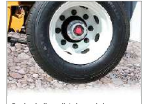
Ruedas de disco pilotadas por buje Clasificación de rueda más alta Tambores externos para un mantenimiento más fácil Montaje más rápido y sencillo Eliminar el bamboleo de las ruedas