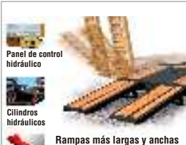
Panel de control hidráulico Cilindros hidráulicos Rampas más largas y anchas Rampas de 8' de largo x 3' de ancho Ofrecen el ángulo de carga más bajo de la industria Válvulas de contrapeso hidráulicas Almacenamiento vertical Permite el máximo uso del espacio de la plataforma