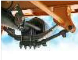
Conejera 9700 suspensión regulable de 3 hojas Clasificado @ 50,000 lb. Tandem, 75,000 lb. Triple. Vida más fuerte y más larga. Estándar en todos los remolques de 15 a 25 toneladas