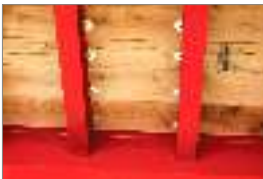
Cubierta de rollo En todos los remolques, los travesaños están perforados a través de los rieles principales para garantizar la altura de plataforma más baja posible y un marco más unificado. La plataforma de rollo se fija a los travesaños con pernos y arandelas para plataforma. Es más fácil reemplazar la plataforma cuando sea necesario