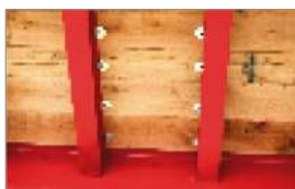
Cubierta de Roble

Usa amers Plus (bloqueo positivo bajo sello) Más brillante sin filamento que se queme. Vida prácticamente ilimitada Carcasa amortiguadora