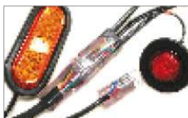
Arnés cableado 100% sellado

Usa amers Plus (bloqueo positivo bajo sello) Más brillante sin filamento que se queme. Vida prácticamente ilimitada Carcasa amortiguadora