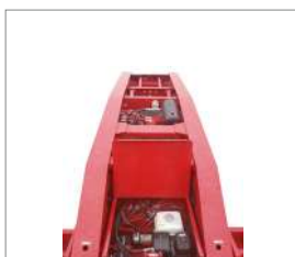
Motorin 13 HP